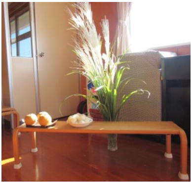
遊戯室にお供えをしました。